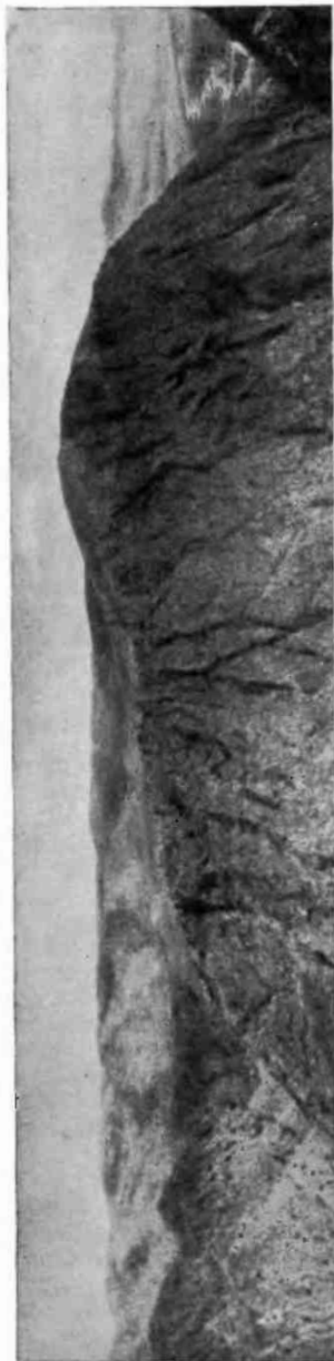
Рис. 1. Древняя поверхность выравнивания на Катарском массиве, откопанная из-под плиоцен-нижнеплейстоценовых конгломератов и прорезанная четвертичной эрозией.

Различие в разрезах молассовых конгломератов на поверхности Катара и в останцах Больших Саев, а именно отсутствие на вершинной поверхности Катара массagetских отложений, подстилающих бактрийские конгломераты в Саях, дает основание считать эти долины древними (мас-